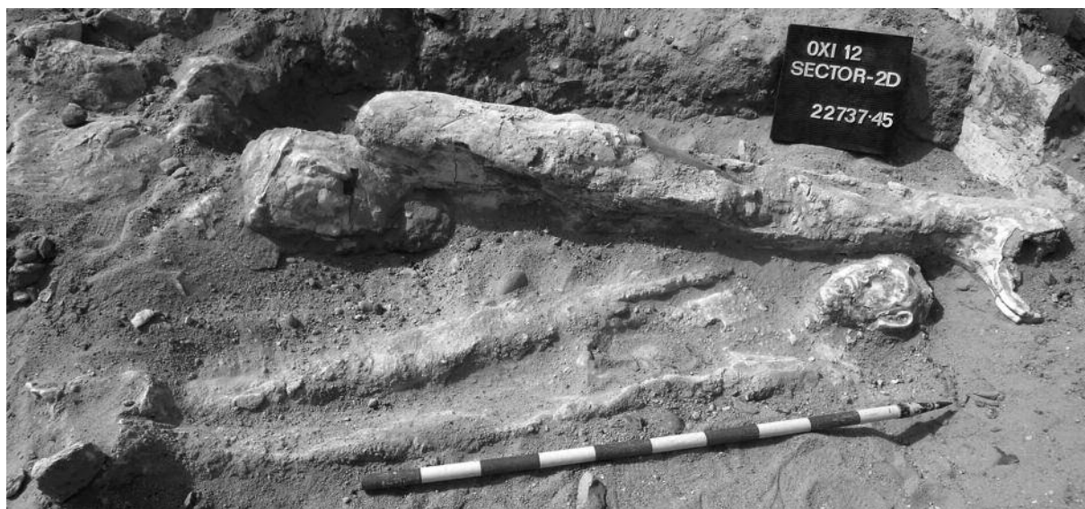
Fig. 3. Momias con cartonajes halladas en Ámbito 32.

cartonaje se distingue de forma muy marcada las sandalias de tiras pintadas en negro y los dedos de los pies. La momia tenía en el interior de la boca una lámina de oro en forma de lengua.