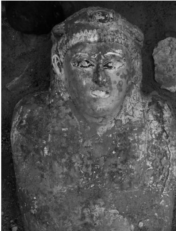
Fig. 2. Momia con cartonaje hallada en tumba 31.