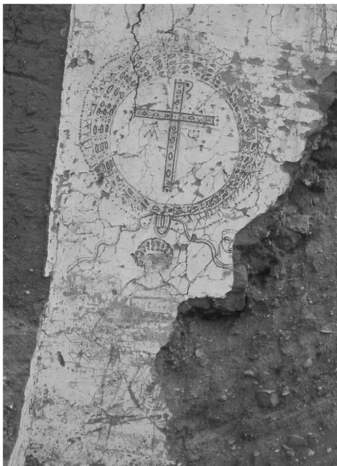
Figura 5. Pintura mural en què hi ha una creu monogramàtica i dos personatges.