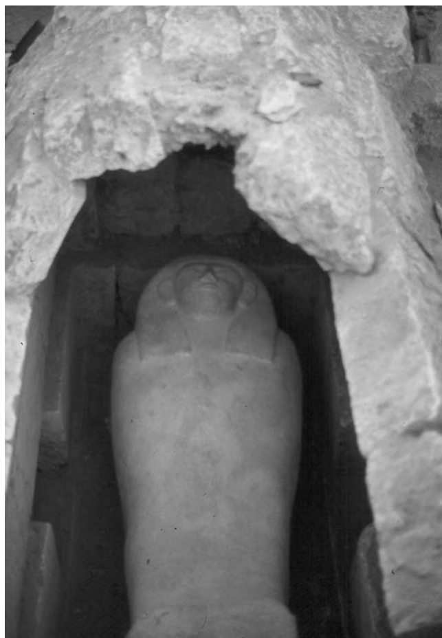
Figura 3. Sarcòfag antropomorf de l'època saïta.

de precisar. Els saquejadors hi van entrar desmuntant els carreus de la volta. El reaprofitament cristià del conjunt es constata en unes deposicions que hi ha a les dues cambres laterals i que segueixen els rituals descrits. En un cas, fins i tot es van desplaçar les despulles d'un cos momificat i es van arraconar al fons de la cambra. Com a única troballa destacable del període cristià relacionada amb aquesta tomba número 13, hem de fer esment d'una moneda de l'època bizantina que ens situa pels volts de la primera meitat del segle VII. Aquesta dada cronològica, l'única de què disposem per datar el cementiri cristià tret d'algun fragment de ceràmica que confirma l'horitzó, ens permet suposar que ens trobem davant de l'última ocupació funerària de tot el sector excavat de la necròpolis d'Oxirrinc.