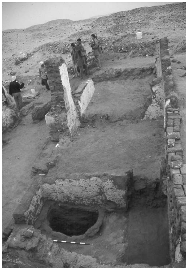
Figura 4. Vista parcial de la capella cristiana.

pat ritual. Entre els cristians, el refrigerium vora la tomba expressava l'acte de refrescar la memòria dels morts i s'acostumava a fer amb aigua freda, pa, vi i altres menjars austers. Es pensa que aquesta tradició era, probablement, d'origen egipci. L'espai està decorat amb pintures: dues tabulae ansatae amb signes críptics i grafitis gairebé il·legibles.