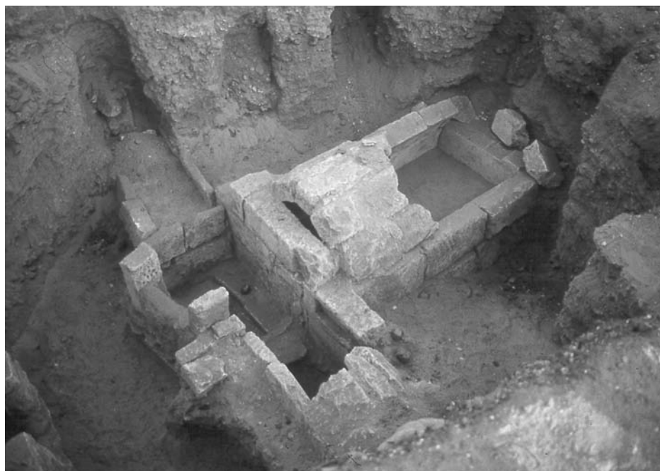
Figura 2. Tomba saïta número 13.