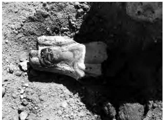
Doc. 35: Détail de l'offrande en terre cuite, in situ.

Ce dernier n'a que les membres inférieurs conservés: ils sont dénudés, le genou gauche étant relevé, la jambe droite repliée. Cette silhouette pourrait correspondre à une représentation d'Harpocrate, 31 petit dieu égyptien, adoptant fréquemment cette position, ou d'Éros, dieu grec. Le personnage féminin, dont la coiffure est surmontée de deux gros boutons de lotus, recouverts d'un voile à l'arrière de la tête, est habillé d'un vêtement court (chiton ?), laissant apparaître les bras et les jambes écartées dans un mouvement d'effort, pour tirer le char, et tient, de sa main gauche, une amphore sur son épaule gauche. 32 Ce personnage, non identifié, ne peut pas être Psyché, aimée d'Éros, car elle est habituellement représentée avec des ailes de papillon. 33 La scène est de style grec (origine: art alexandrin ?).