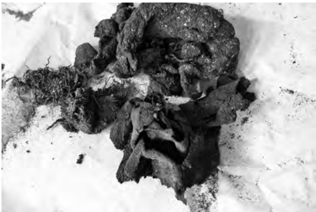
Doc. 50: Tampon textile intra-crânien.

L'endocrâne contient un gros tampon, constitué de bandes textiles enroulées en forme de croissant, autour de l'extrémité céphalique de la tige de «gérid». 53 De fines cor-