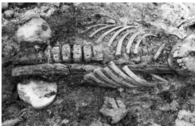
Doc. 54: Détail (le squelette des membres supérieurs a été prélevé).