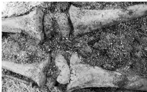
Doc. 55: Articulations des genoux, avec absence de soudure des épiphyses.

Ce sont des textiles de réemploi, sans trace de baumes. Quelques bandelettes constituent un motif décoratif sur le thorax. Des tampons de rembourrage ont été placés sur les membres supérieurs. La face postérieure est recouverte d'une faible épaisseur de textiles.