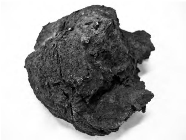
Doc. 40: Le cerveau conservé (face inférieure), avec le cervelet, au-dessus, et la scissure entre les deux hémisphères cérébraux, à gauche du cliché.

Le cerveau 38 est conservé intact, in situ , il présente un aspect très particulier, la scissure entre les deux hémisphères est nette, le cervelet formant un dôme, sur la face inférieure.