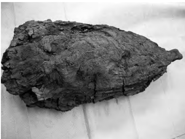
Doc. 44: Le tampon, avec les baumes apparents, à gauche (partie située à hauteur des genoux).