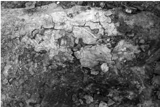
Doc. 45: Linceul peint représentant le haut du corps du personnage (l'épaule gauche est peinte en et entourée d'un liseré jaune).

La momie est recouverte d'un linceul peint, dont le textile est recouvert d'une fine couche de stuc, représentant un personnage momiforme, hiéramphibole (dont les contours de l'arrière de la tête sont presque effacés), vu de profil, tourné vers le côté gauche de la momie (orienté au sud), le torse représenté de face, selon les conventions artistiques, la tête ayant disparu. L'orientation du personnage est identique à celle du défunt sur lequel il veille (est-ouest, tête à l'est). La partie gauche de la silhouette a été détruite.