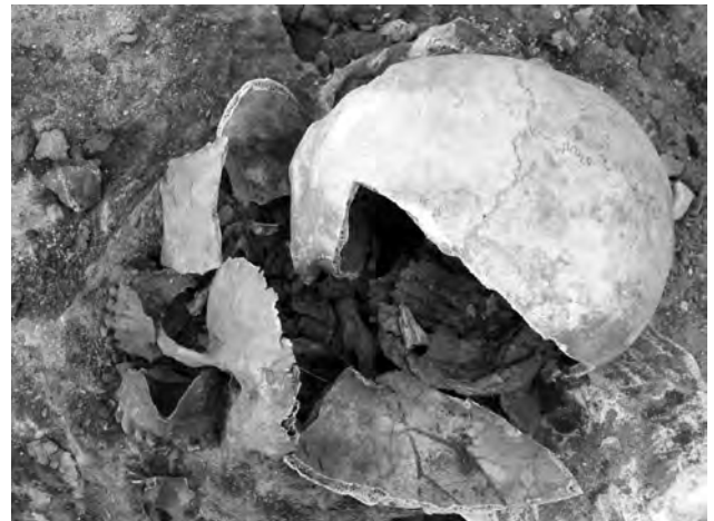
Doc. 39: Le crâne brisé et le cerveau in situ.