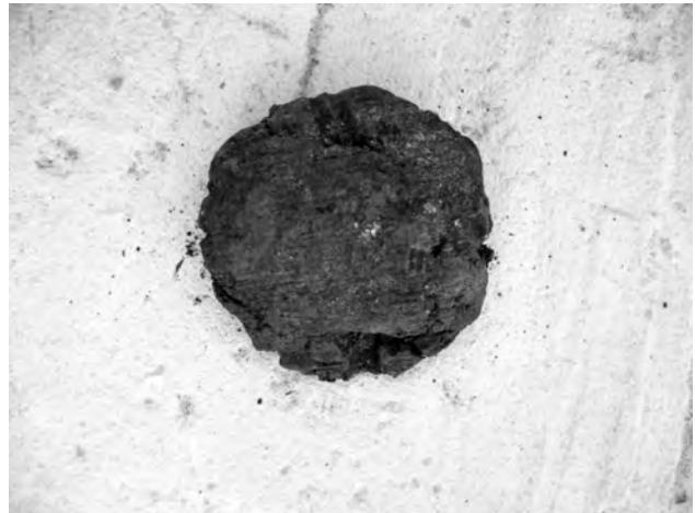
Doc. 34: Petite plaque retrouvée dans la fosse lombaire droite.

- Petite plaque en matière organique 27 (terre 28 ?) d'une largeur de 3,5 cm.