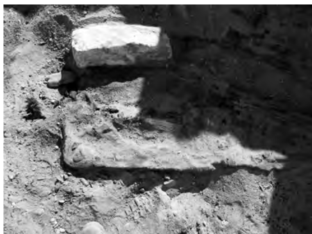
Doc. 31: La momie acéphale (l'aile iliaque gauche sortant des textiles).

Seules les cuisses sont conservées. Les fémurs mesurent 42,5 cm 26 (longueur physiologique). Le fémur droit est fracturé à son extrémité supérieure ( post-mortem ).