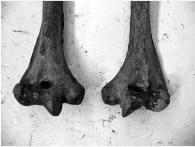
Doc. 33: Perforation olécrânienne humérale.