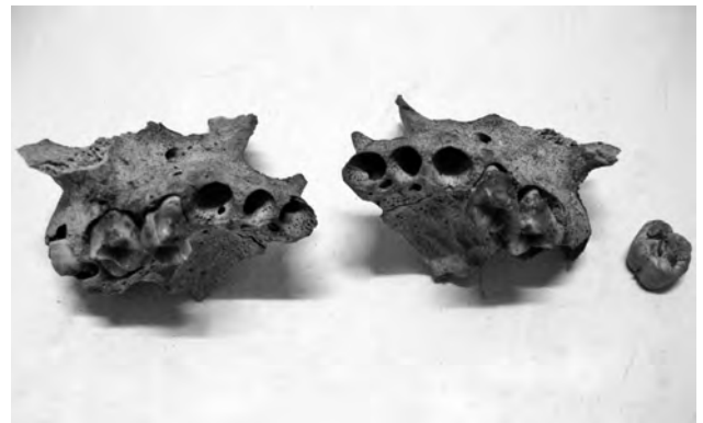
Doc. 51: Le maxillaire avec la formation des futures molaires.

Le stade d'éruption dentaire correspond à un âge d'environ 2 ans.