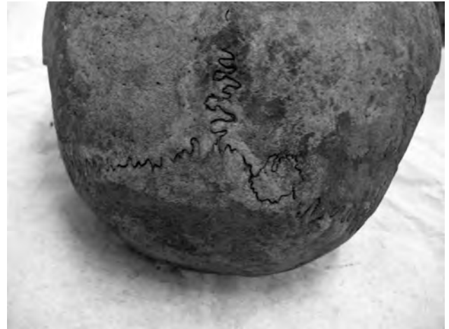
Doc. 42: Le crâne (norma occipitalis), un os wormien observable à droite de lambda.