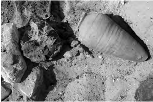
Doc. 49: La tête calée par des pierres avec la céramique déposée en offrande.