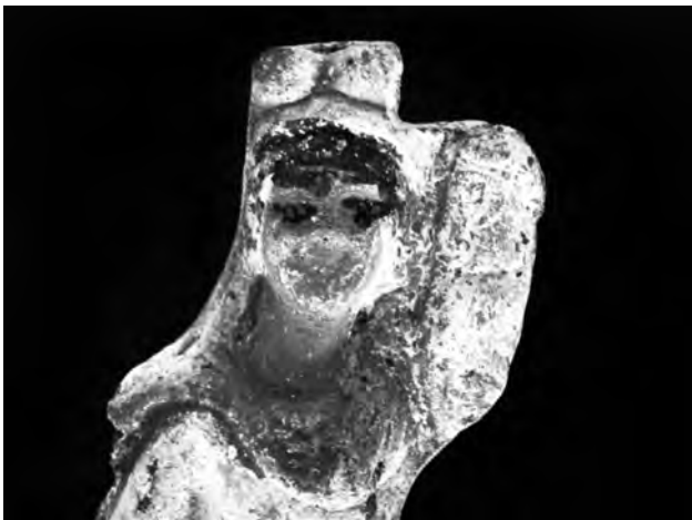
Doc. 37: Détail du visage.

Dimensions: longueur (diagonale) 25,5 cm, épaisseur 3,5 cm.