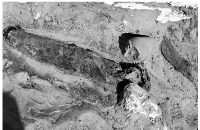
Doc. 48: La momie avec le dépôt de la céramique.