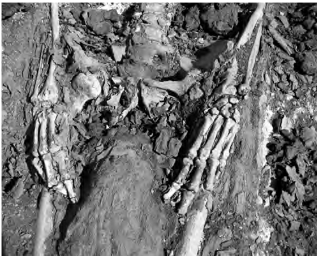
Doc. 43: Tampon constitué de textiles enveloppant des tissus momifiés enduits de baumes.

Les fémurs mesurent 43 cm. Les tibias (35,5 cm: longueur maximale) et les fibulæ présentent une fracture post-mortem . Le squelette des pieds est incomplet.