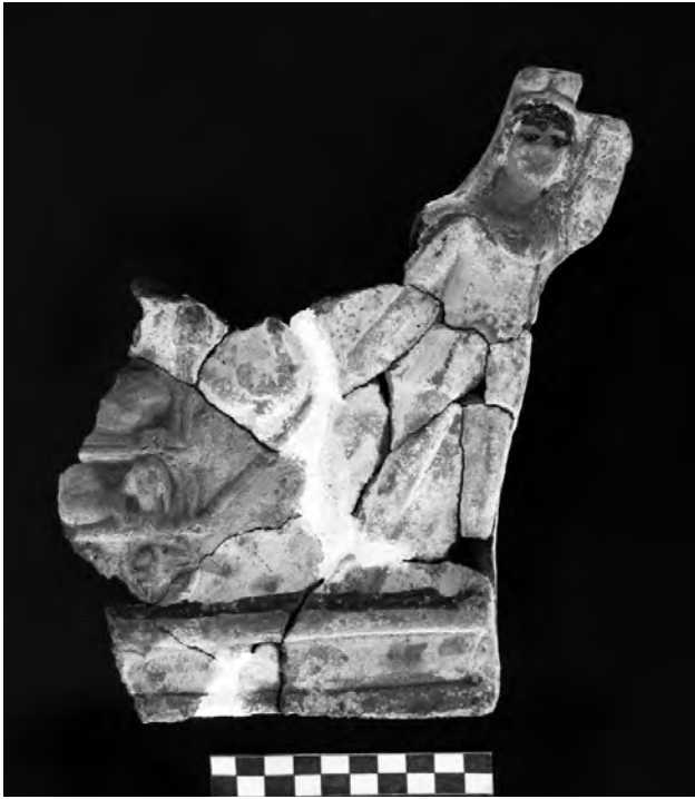
Doc. 36: L'objet restauré.