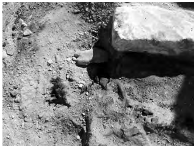
Doc. 32: Détail de l'emplacement de la tête (cuir chevelu) et objet en terre cuite (à gauche de la pierre).