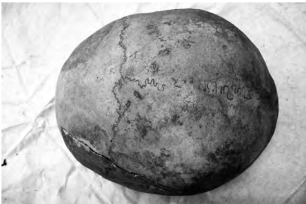
Doc. 41: Le crâne (norma verticalis).

Le crâne, de forme sphéroïde, présente des caractères masculins: torus sus-orbitaire (orbite gauche), apophyse mastoïde gauche large, crête nucale et angles mandibulaires marqués. La suture coronale est discrète, un peu effacée, la sagittale (S2 & S3) et la lambdoïde (L3) sont en cours de synostose. Un os wormien est situé à droite de lambda.