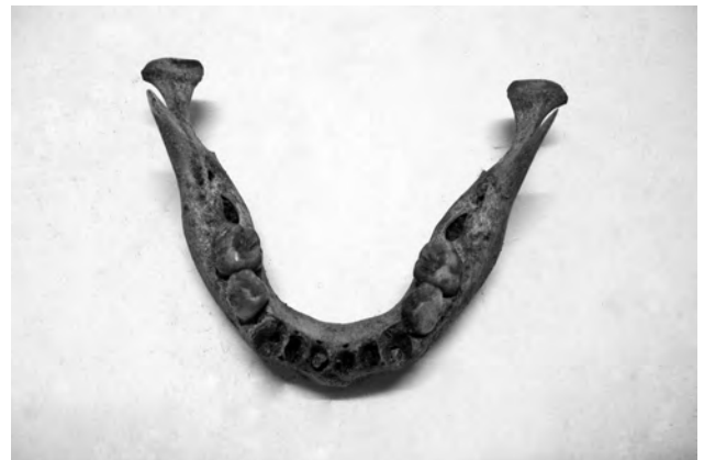
Doc. 52: La mandibule.