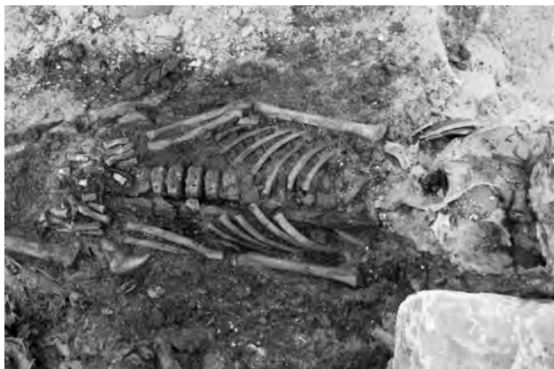
Doc. 53: La tige de gérid traversant la cavité-thoraco-abdominale.

Le rachis et le sacrum sont totalement fragmentés, compte tenu du jeune âge du défunt.