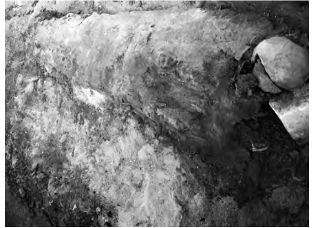
Doc. 38: La momie recouverte de son habillage (la pierre soutenant la tête n'a pas été déposée à l'origine).