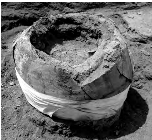
Fig. 1. Primera gasa col·locada per a poder continuar amb el procés d'excavació.

Aquest engassat va consistir, primerament amb bandes adhesives de tipus clínic i després amb un engassat amb gasa de cotó i Paraloid al 30% diluït en acetona, col·locat per sota la decoració pictòrica i per tal de realitzar una faixa de contenció. Això va permetre l'excavació in situ i completa de l'interior de la ceràmica.