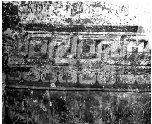
Fig. 8. Detall de la decoració geomètrica.

En la cala esmentada anteriorment hem localitzat que la franja vermella inferior presenta també inscripcions incises. Torna a ser el 1,8 metres.