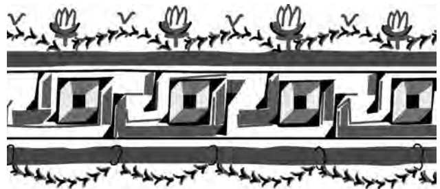
Fig. 9. Croquis de la decoració de la segona capa.