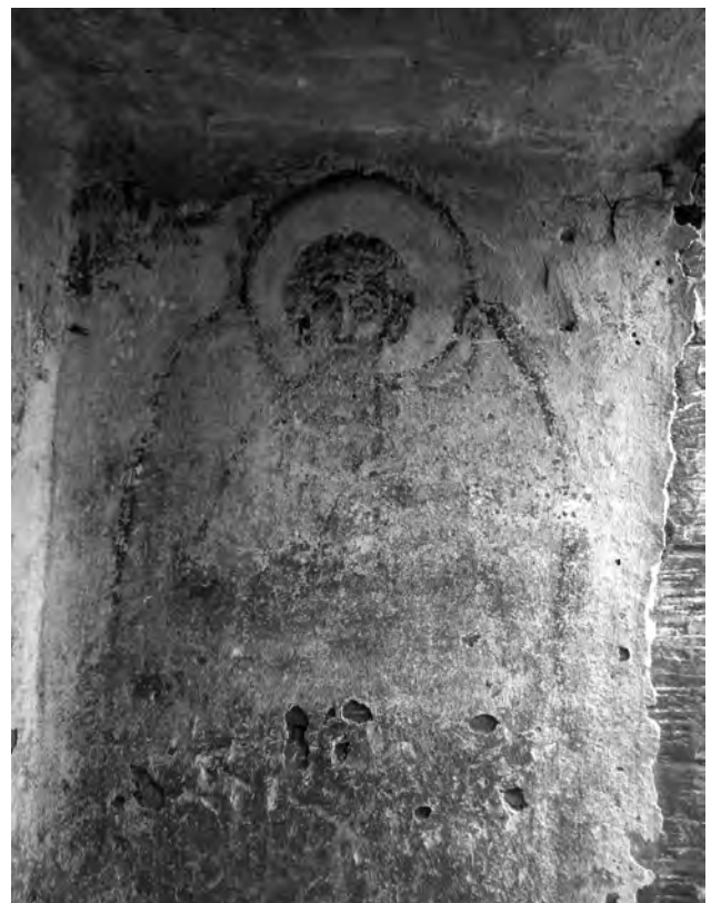
Fig. 2. Paret sud de la fornícula.

L'altra part de les tasques realitzades al jaciment foren les intervencions a la cripta del sector 24. Aquestes tasques foren la realització de cales, intentar entendre la superposició de capes pictòriques, així com la consolidació i protecció d'alguns trams. De totes maneres aquí