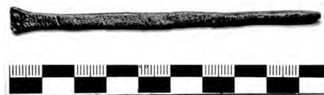
Fig. 4. Cisell de plom del sector 24. U.E. 24285.

De totes maneres també s'han restaurat unes pinces i un picarol, ambdós de bronze, del sector 29, i del sector 24 un cisell de plom de petites dimensions (fig. 4).