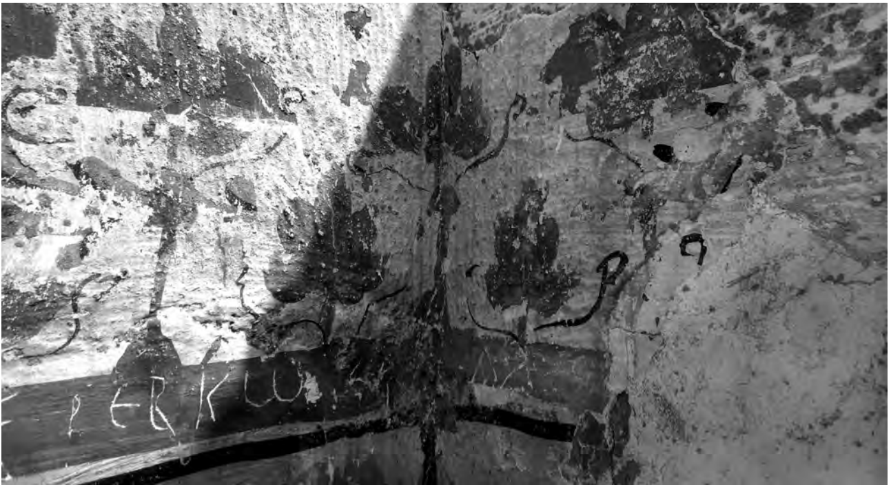
Fig. 7. Detall de la decoració vegetal de la primera capa.

veure el que hi havia per sobre el 1,75 m. Encara no en sabem res de les parts inferiors.