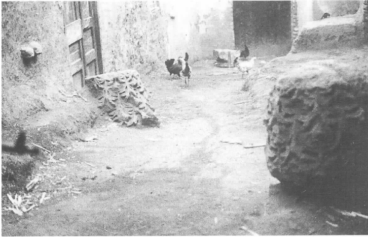
Fig. 2. Carrer de Safaniya (antiga Espania) amb restes arquitectòniques antigues.

cementiri musulmà: al peu d'aquest turonet vam poder veure parets de tovots i vam poder recollir alguns fragments ceràmics antics.