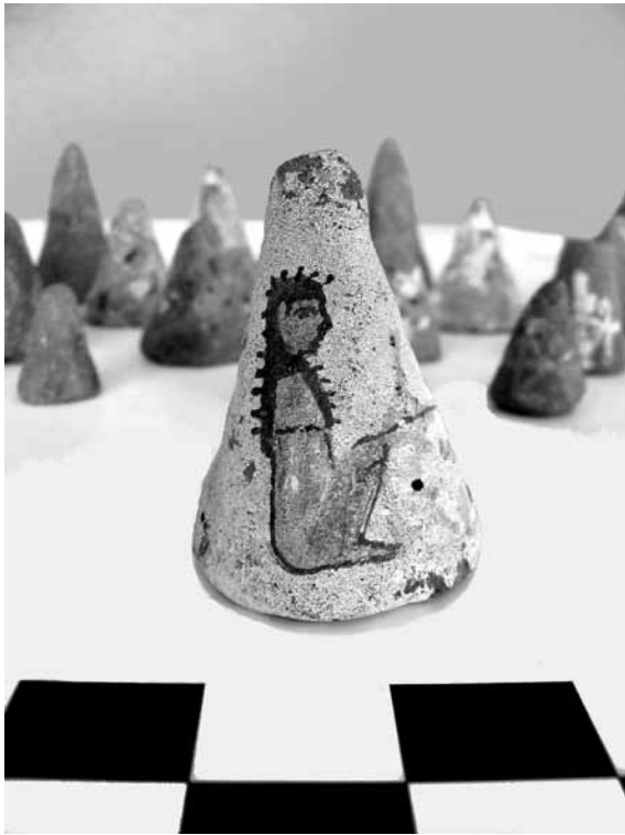
Figura 7. Conos de barro que llevan una inscripción o la representación de la diosa Neith arquera

Entre el ajuar funerario localizado y relacionado con el culto y el ritual de los misterios de Khoiak 15 destacaremos diversos materiales vinculados con la protección de Osiris: