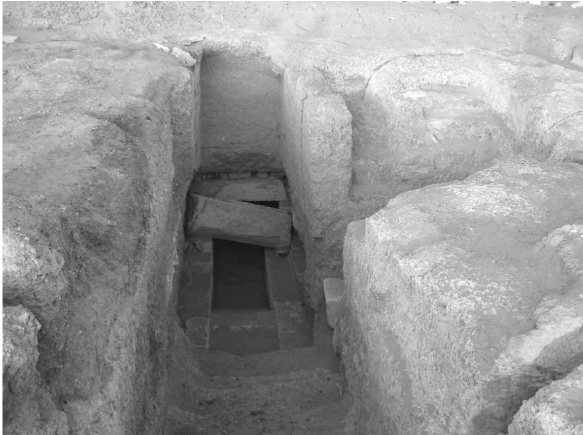
Figura 2. Entrada principal a las catacumbas osiriacas

Podemos afirmar que nos encontramos en una zona donde se realizaban las ofrendas rituales diarias en favor de Osiris.