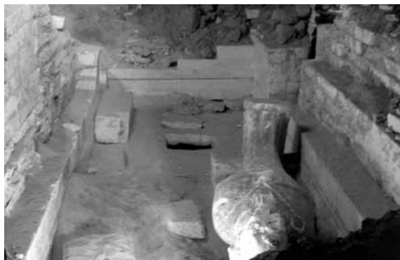
Figura 4. Sala de Osiris

Ya en el exterior, y en la parte lateral derecha (mirando a la entrada), se aprecian dos pequeñas escaleras auxiliares talladas en la roca, que