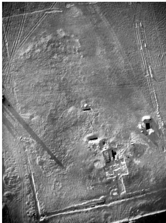
Figura 1. Foto aérea del área del Osireion

El recinto fue ampliamente reestructurado durante los reinados de Alejandro II Aegos, hijo de Alejandro Magno, Ptolomeo I Soter y Ptolomeo II Filadelfo; así lo atestiguan los diversos bloques hallados por los saqueadores hacia los años cincuenta del siglo pasado, decorados con relieves y textos jeroglíficos con el nombre de su lugar de procedencia: Pr-hf . Dichos bloques