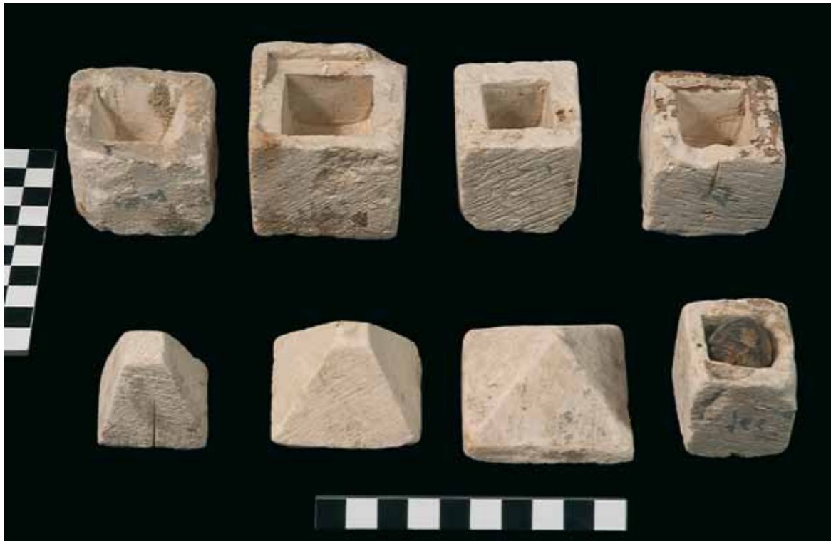
Figura 6. Cajitas de piedra caliza, con inscripciones en demótico, cerradas con tapaderas de formas piramidales. En su interior se encontraron pequeñas bolas de barro recubiertas de vendas

de Ptolomeo VIII Evergetes y de Cleopatra II, así como el nombre particular de cada Osiris y la fecha del año de reinado de los soberanos en que se efectuó el sepelio del simulacro osiriaco. Figura también el nombre de la necrópolis, Pr-hf , nombre que ya aparece referenciado en los textos del sarcófago de Het (Tumba núm. 1 de la necrópolis saíta), donde se especifica que el propietario ostentaba, entre otros cargos, el de hm-ntr de Bastet en el Pr-hf 11 .