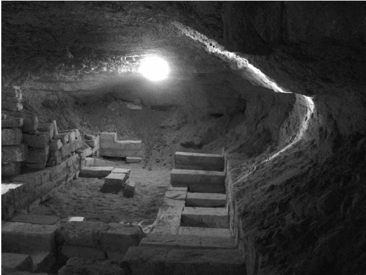
Figura 5. Galería de nichos

por la curvatura de la hilada de arranque, reposa la estatua yacente de Osiris, de 3,30 m de longitud. La imagen del dios, esculpida en un bloque calizo, presentaba un color negro algo degradado, el color de la regeneración. Lleva los atributos propios de la divinidad: el cuerpo amortajado, las manos sosteniendo el heqa y el nejaja . La cabeza, hoy desfigurada, está tocada con la corona atef . En esta estancia, presidida por la colosal estatua, se rendía culto a Osiris.